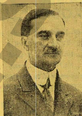
D. Iuliu Maniu

fi lămurit opinia publică ce se înțelege prin formula așa de