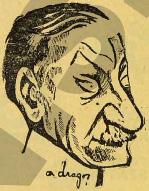
D. IULIU MANIU

inimă de gheață, n'a fost prezent la funeraliile naționale ale lui Octavian Goga. Socotelile lui mărunte, calculele lui politice, distilate printr'un suflet lipsit de sensibilitate, l-au dictat să se țină departe, să distoneze de simțirea țării înlăcrimate, când rațiunea, o elementară decență, ar fi trebuit să-i comandă o atitudine cu totul deosebită.